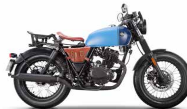
ROYAL BLUE MATT / HORIZON BLUE MATT

* rispetta il Regolamento Delegato (UE) N. 134/2014 della Commissione, allegato VII