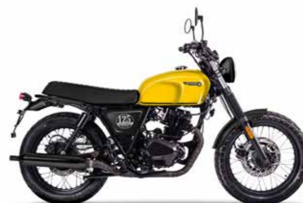
SUBMARINE YELLOW 2