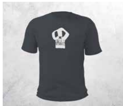
T-SHIRT SKULL - TIMBERWOLF GREY