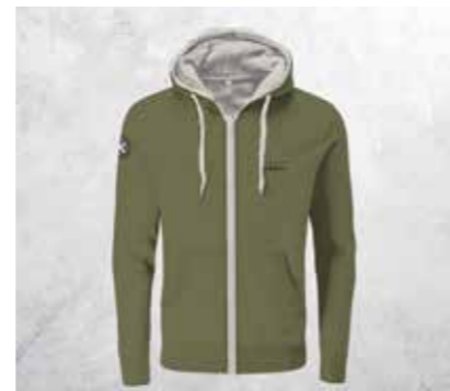
FELPA CON ZIP E CAPPUCCIO COMPASS