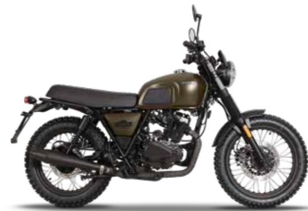
CHARLY BROWN 2