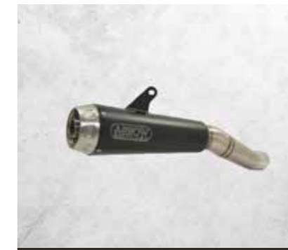
IMPIANTO DI SCARICO ARROW IN ACCIAIO INOX