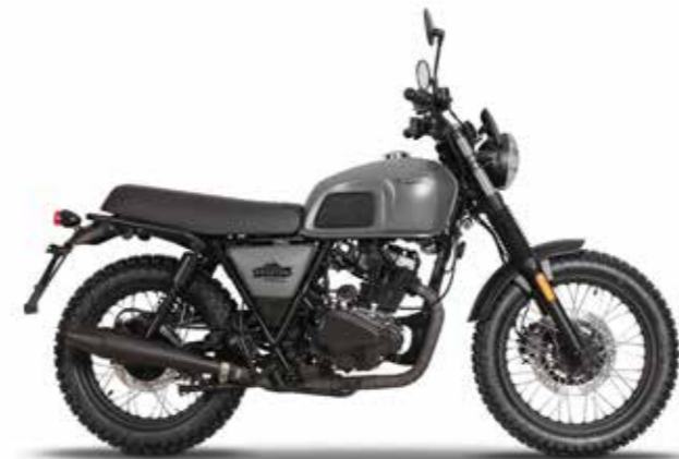
TIMBERWOLF GREY 1