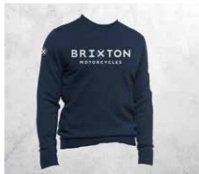
FELPA CON STAMPA BRIXTON