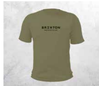
T-SHIRT COMPASS - MOSS GREEN