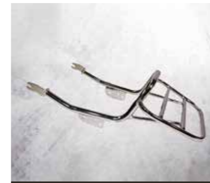
PORTAPACCHI NERO O CROMATO