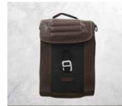
BORSE LATERALI IN PELLE (CROSSFIRE 500)