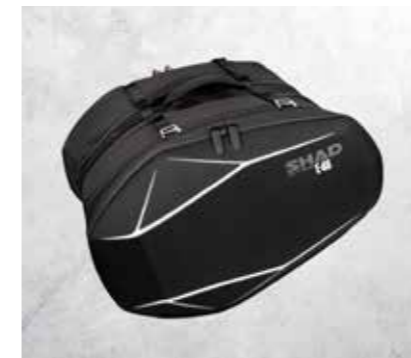
BORSE LATERALI SHAD (CROSSFIRE 500)