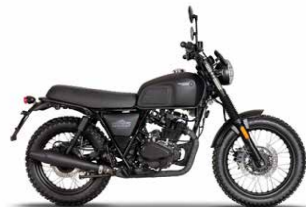
BACKSTAGE BLACK 1