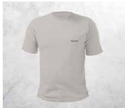
T-SHIRT COMPASS - LIGHT GREY

Segui il tuo stile e porta in strada la tua moto Brixton come più ti piace. Scegli tra una varietà di accessori, tra cui marmitte, serbatoi, selle colorate e manubri per personalizzare al massimo la tua moto, che diventa unica come te. Per un elenco dettagliato delle proposte visita il sito brixton-motorcycles.com/parts