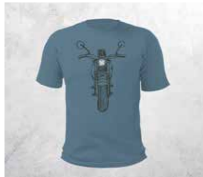
T-SHIRT X-LIGHT - HORIZON BLUE