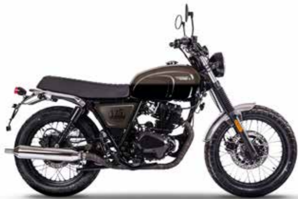
CHARLY BROWN / TITAN BLACK 1

* rispetta il Regolamento Delegato (UE) N. 134/2014 della Commissione, allegato VII 1 Dotazioni di serie sui modelli Cromwell 125 Charly Brown e Backstage Black 2 Dotazioni di serie sui modelli Cromwell 125 Submarine Yellow e Timberwolf Grey