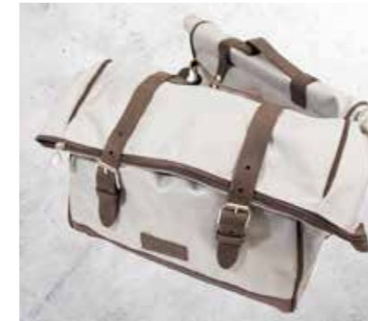
BORSE LATERALI INCL. SUPPORTO