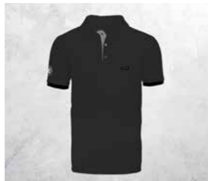
POLO CLASSICA - BACKSTAGE BLACK