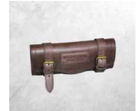
BORSA DEGLI ATTREZZI