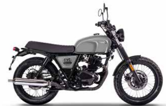
TIMBERWOLF GREY 2