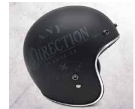
CASCO - OPEN FACE BLACK MATT