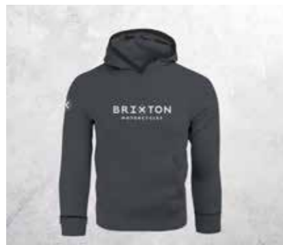
FELPA CON CAPPUCCIO SKULL