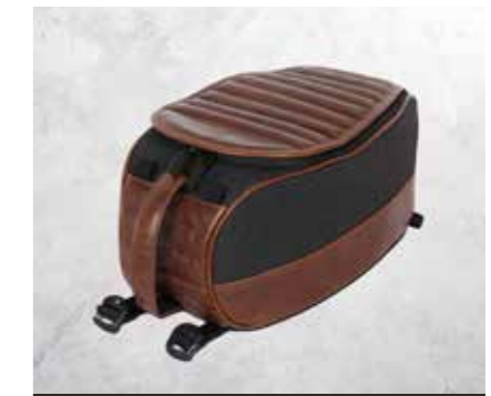
BORSA SERBATOIO (CROSSFIRE 500)