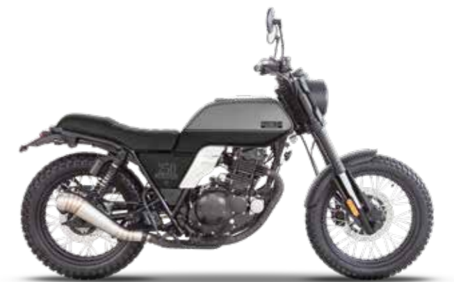
TIMBERWOLF GREY / BACKSTAGE BLACK