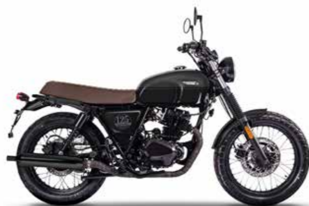
BACKSTAGE BLACK / TITAN BLACK 1