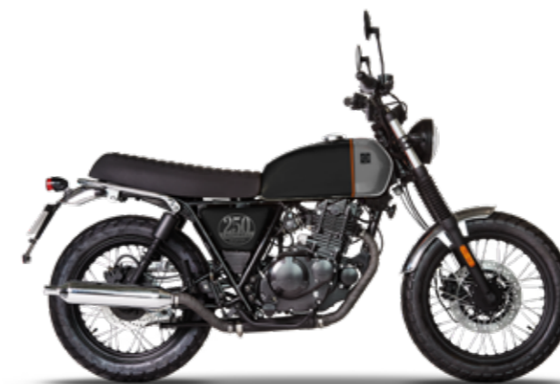
TITAN BLACK / STERLING GREY

* rispetta il Regolamento Delegato (UE) N. 134/2014 della Commissione, allegato VII