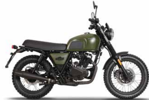
CARGO GREEN 1