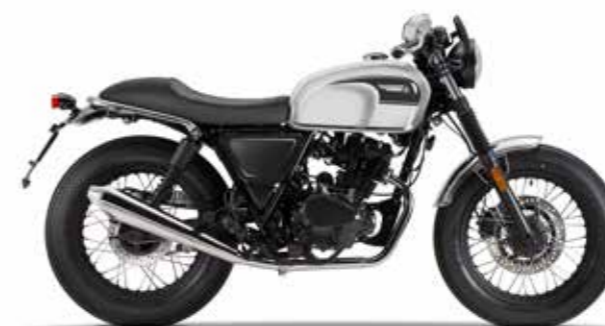
BULLET SILVER / BACKSTAGE BLACK

* rispetta il Regolamento Delegato (UE) N. 134/2014 della Commissione, allegato VII