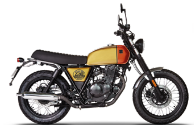
DESERT GOLD / CLOCKWORK ORANGE