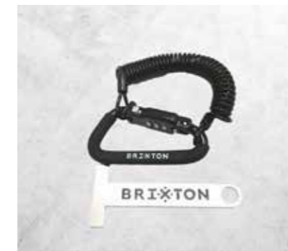
LUCCHETTO PER IL CASCO