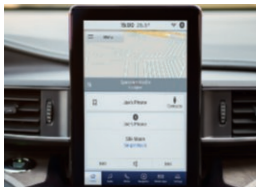
Touch screen LCD TFT 10,1" con orientamento verticale.