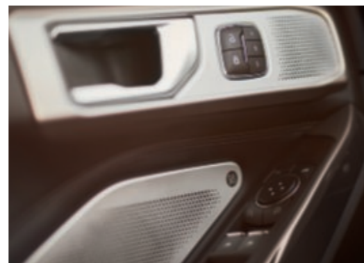
B&O Sound System con 14 altoparlanti e subwoofer.