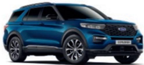
Atlas Blue †

Colore carrozzeria metallizzato perlescente*